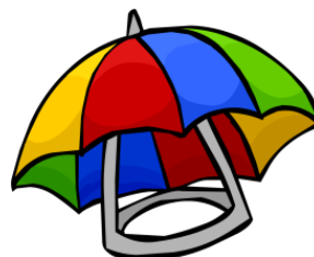
The Umbrella Hat