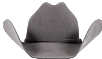
Kettle Brim Hat