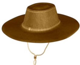
The Sou'Wester Hat