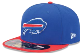
Bill Or Visor