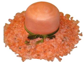
Peach Basket Hat